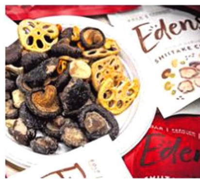
Edens零嘴主打真空油炸香菇片。

两名创办人掏出5万元创业，团队有四人。现金流是他们的最大挑战，没设办公室也没库存，食品包装外包，正在扩大营业额，累积资金设实体销售点。