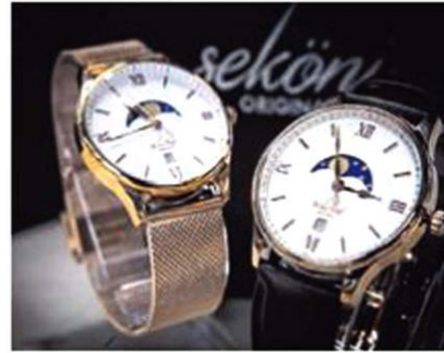
Sekoni Original第一支手表Tidal-moonphase，告知月的阴晴圆缺。

品牌第一支手表Tidal-moonphase（潮汐期，$285）有个半月形设计，告知月的阴晴圆缺，五年保用期。只有会员才能预购手表，已吸引1600名，本地人占七成。今年会推出三款新手表，其中一款结合