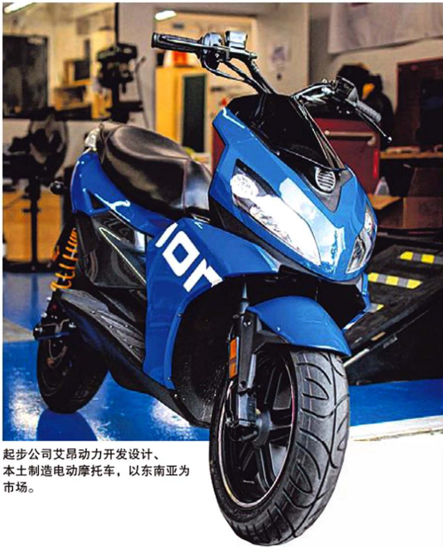
起步公司艾昂动力开发设计、本土制造电动摩托车，以东南亚为市场。

他获得新大1万元资金援助，认同其商业创新孵育项目的无股权政策，与小众品牌（如设计高端床寝品牌、上千元iPhone手机壳）的过来人交流获益匪浅。他还开发Load & Go送货服务应用软件，聘用10名司机专攻高端产品市场，去年生意特佳。